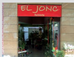
EL JONC Floristeria Isern, 9