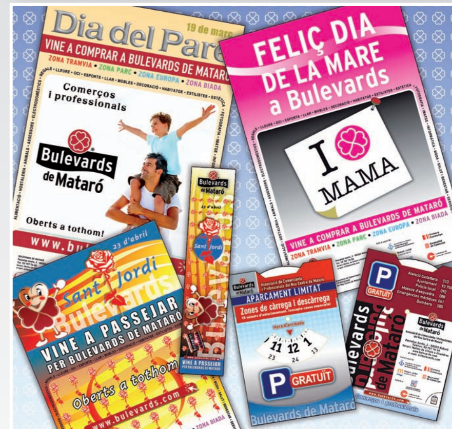
Els rellotges horaris han tingut molt bona acollida per tots!