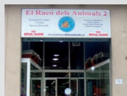
EL RACÓ DELS ANIMALS II Via Europa, 53